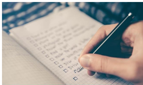
Monitoring of CPD for your teachers and trainers