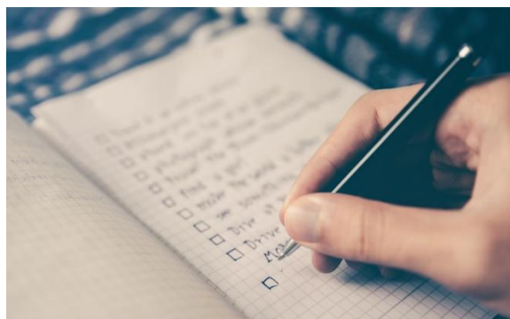
Monitoring of CPD