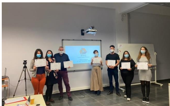
The 3rd IPAL transnational meeting in Athens