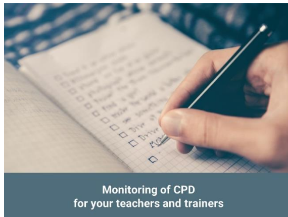
Monitoring of CPD for your teachers and trainers