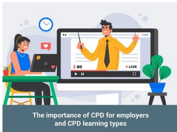
The importance of CPD for employers and CPD learning types

In unserem Blog finden Sie interessante Artikel, um sich mit dem Thema der beruflichen Weiterbildung und ihrer Bedeutung für die Verbesserung der Unterrichtspraxis in der Erwachsenenbildung vertraut zu machen.