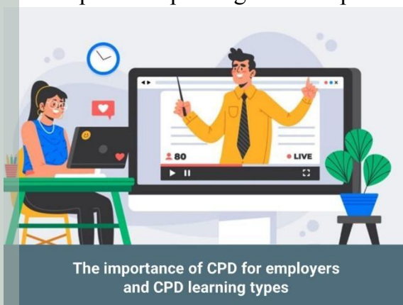
The importance of CPD for employers and CPD learning types

Nel nostro blog troverete articoli interessanti per familiarizzare con la SPC e la sua importanza per migliorare le pratiche didattiche nell'educazione degli adulti.