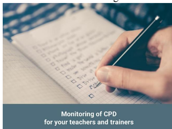
Monitoring of CPD for your teachers and trainers