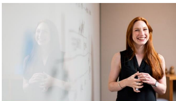
Why knowing how your adult education organisation performs in CPD matters