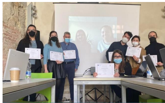
A resourceful meeting in the treasure city of Mantua