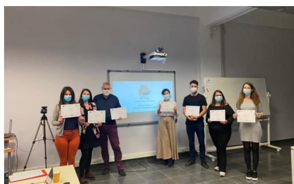
The 3rd IPAL transnational meeting in Athens