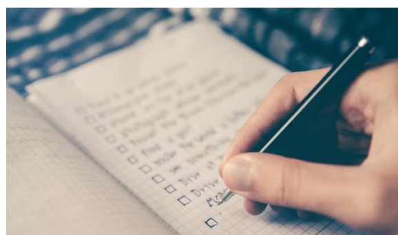
Monitoring of CPD