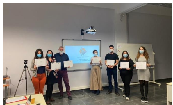
The 3rd IPAL transnational meeting in Athens