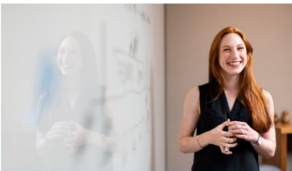
Why knowing how your adult education organisation performs in CPD matters