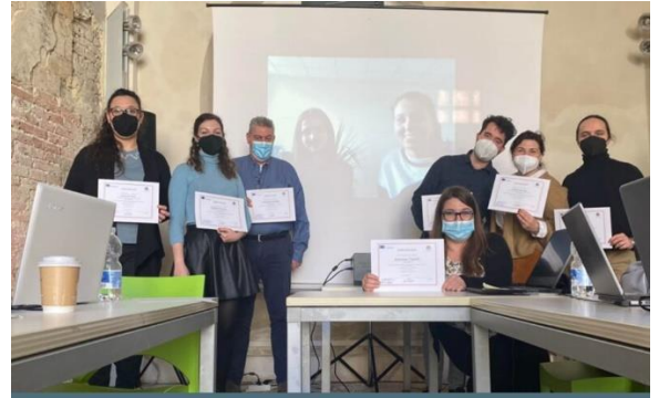
A resourceful meeting in the treasure city of Mantua